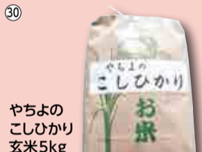
30 やちよのこしひかり玄米5kg…6人 八千代市農業協同組合経済センター ☎459-8126