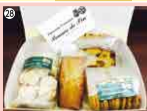
28 焼き菓子セット…5人 パティスリー・ポム・ド・パン ☎486-2226

※その他広報事業への感想や希望があればお書きください。応募の際に得た個人情報(住所等)は当事業のみに使用し、他の用途には使用しません。