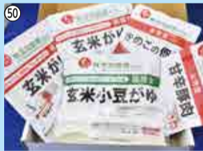
50 非常食セット(1人3食分)…15人 八千代市防災設備協同組合 ☎487-3260