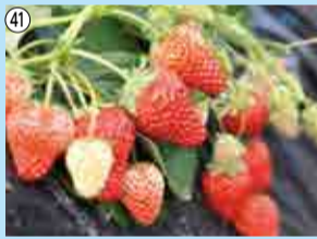
41 いちご狩り入園券(ペア券)…5組10人 農事組合法人 島田 ☎080-1306-9752