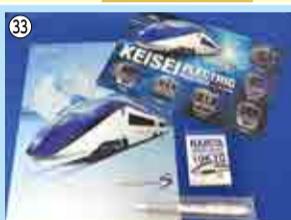
33 ノベルティセット(クリアファイル、ボールペン、メモ帳、下敷き)…10人/京成電鉄株 ☎0570-081-160