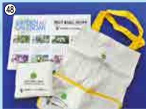
48 エコバッグ&花のタネ付きガーデンカレンダーのセット…20人 (公財)八千代市環境緑化公社 ☎458-6446