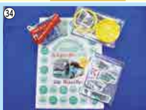
34 ノベルティセット(ペン立て、マグネット、クリアファイル、定期入れ)…10人/京成バス株 ☎047-712-7378