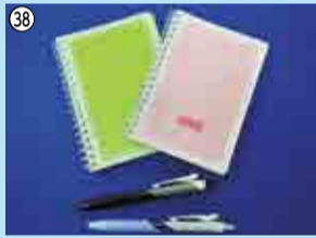
38 大学名入りボールペン、大学名入りポケットノートA6のセット…25人/秀明大学 ☎488-2331