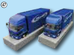
47 日野自動車モデルトイトラック(1/43サイズ)…3人 株ホリキリ ☎484-1111