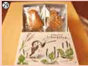
29 そらちゃんサブプレ詰め合わせ…5人 パティスリー ランパルフェ ☎450-0599