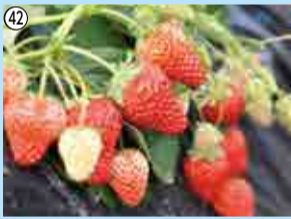
42 いちご狩り入園券(ペア券)…5組10人 農事組合法人 米本 ☎090-2461-4814