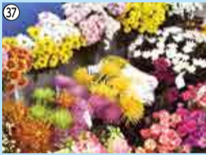
37 ギフト券1,000円分…5人 街江緑園園芸センター ☎488-8970