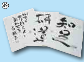
49 書道小作品…5人 八千代市書道会 ☎483-2637