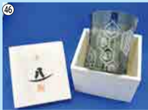
46 八千代切子グラス…2人 東洋佐々木ガラス株 ☎459-3101