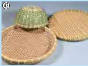
43 手作りの竹細工…7人 竹細工同好会(郷土博物館内) ☎484-9011