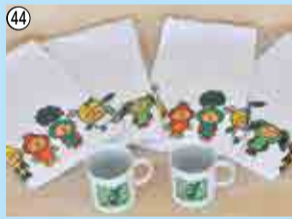
44 マグカップ・フェイスタオルセット…10人/東京女子医科大学附属八千代医療センター ☎450-6000