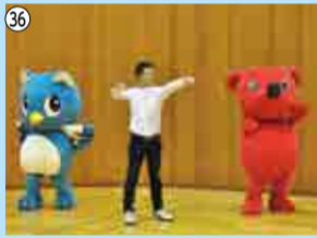
36 やちよ元気体操DVD・CDセット…5人 八千代市健康づくり課 ☎483-4646