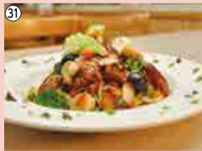
31 香味野菜とチキンのラグースパゲティハーブ添え…30人 レストラン ラ・ローズ ☎459-6388