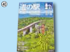
40 道の駅旅案内全国地図(平成28年度版)…5人 株ゼンリン 千葉営業所 ☎043-261-0043