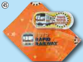
45 (a)トリムセット…5人 (b)レジャーシート…5人 東葉高速鉄道株 ☎458-0015