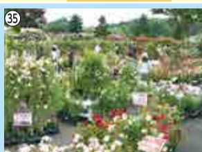
35 ペアチケット招待券…5組10人 京成バラ園芸株 ☎459-3347