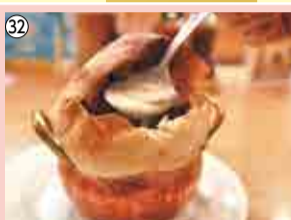
32 きのごスープ(大)…10人 レストラン ロス・アンジェルス ☎484-3388