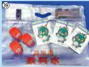
39 安心・安全グッズセット…10人 ※非常用給水袋/八千代市上下水道局、反射ストラップ・ライト/八千代市生活安全課