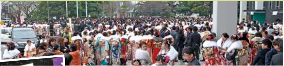
▲市民会館前に集まる新成人

式典のほか、和太鼓集団「琉翔」によるオープニングセレモニーや、成人式プロジェクトによる「感謝～過去から未来へ歩む時～」をテーマにしたスライドショーなどの記念行事も行われました。小学校・中学校時代の先生からのメッセージや展示されたジャージ(体操服)を見て、当時の懐かしい思い出を振り返っていました。