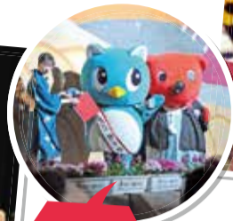
やちよとチーパくんもお祝いに