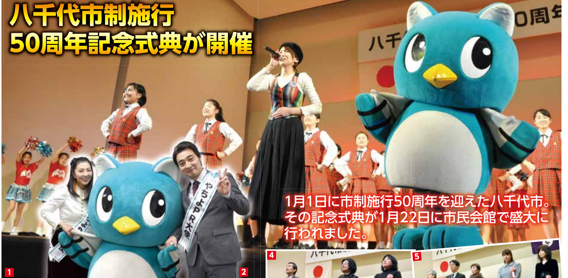
1月1日に市制施行50周年を迎えた八千代市。その記念式典が1月22日に市民会館で盛大に行われました。