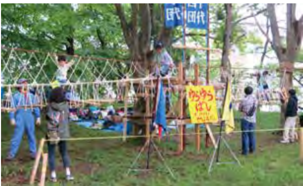
▲過去の活動の様子(村上緑地公園)

今年のテーマは「～とべ!!はしれ!!集まれ ミカラム運動場～」。アスレチックやクラフト体験コーナーなど。市内在住の3歳以上の人が対象です(小学2年生以下は保護者同伴)。昼食、飲み物、筆記用具、帽子持参(雨天時は上履きも)。動きやすい服装でご参加ください。事前申し込みは不要です。当日直接会場へお越しください。駐車場はありませんので、公共交通機関をご利用ください。