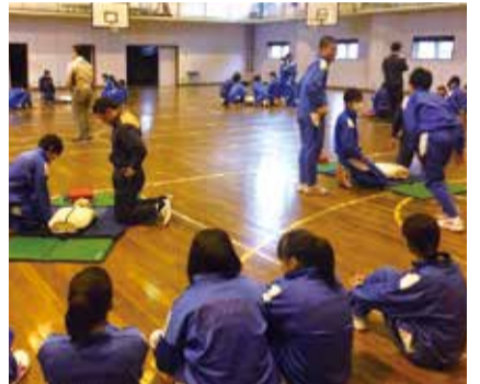
▲八千代台西中学校での救命講習

消防署では、2012年度から、いざという時に「火を消せる」「人の命が救える」人間を育成する防災教育プランを行っています。その中の救命講習では、毎年約2,000人の中学生が受講しています。4月11日におこなわれた八千代台西中学校3年生を対象とする救命講習で、受講延べ人数が1万人を超えました。2021年度には、受講者が市内の人口の約1割、2万人に到達する見込みです。消防署ではこれからも普及活動を続けていきます。