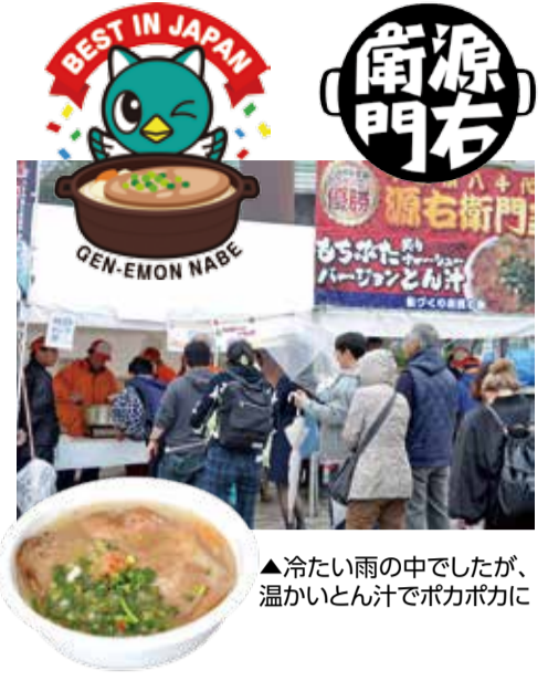
▲冷たい雨の中でしたが、温かいとん汁でポカポカに

4月8日・9日、源右衛門祭が総合運動公園多目的広場で開催されました。雨の影響で、ステージイベントの多くは残念ながら中止となりましたが、出店やイベントブースは予定どおり開店。中でも、1月に開催された「ニッポン全国鍋グランプリ2017」で2度目の優勝を果たし、見事殿堂入りした、「もちぶた炙りチャーシューバージョンとん汁」には、来場者がグランプリの味を求め、列を作っていました。