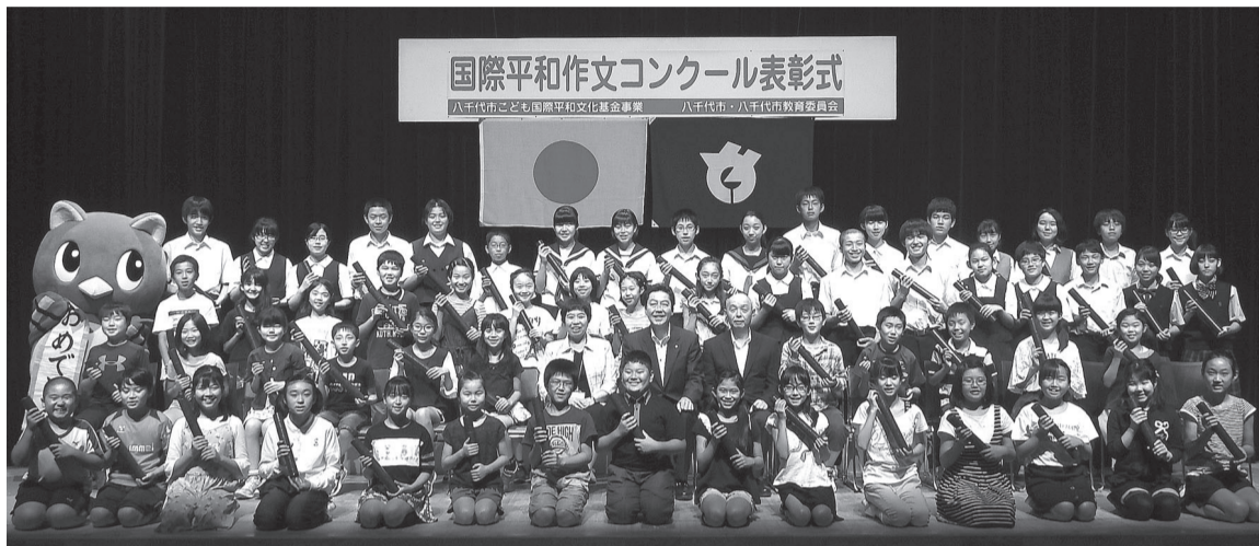
6月28日に表彰式が行われました

入選作品をまとめた作文集「君たちを忘れない」第29集は、30年3月頃から市内の図書館で閲覧できます。また、入選者の中から八千代こども親善大使が選ばれ、友好都市バンコク都を訪れます。