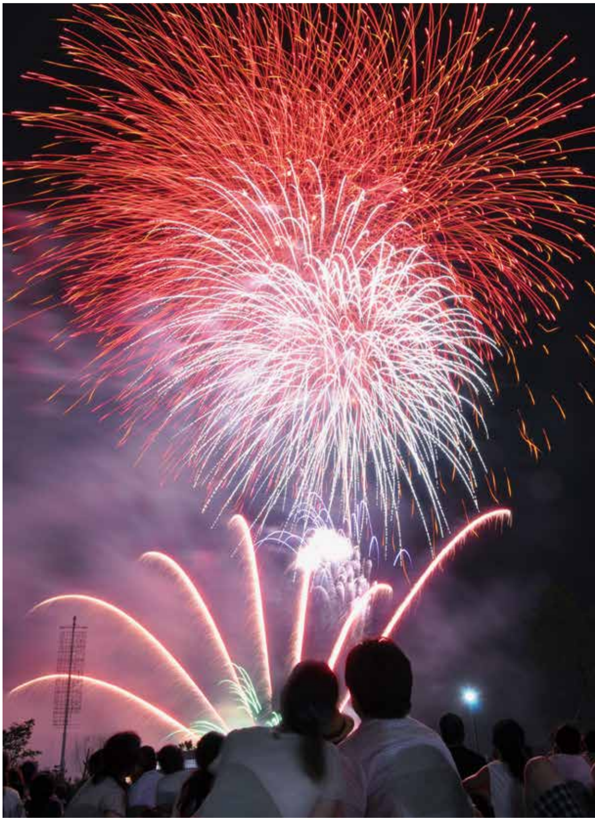
▲目の前に上がる花火をじっくり楽しめる観客席。お腹に響く音もこの近さならではの醍醐味

市制50周年を記念して、八千代にちなんだ8000発の花火が夜空を彩った、今年の八千代ふるさと親子祭。8月26日に開催され、昨年を上回る約20万人の来場者でにぎわいました。八千代市が誕生した年に生まれた人はもう50歳。市も今では人口約19万7000人の都市に成長しました。この間、親子祭の会場周辺には、新川大橋などが架けられ、東葉高速鉄道が走り、中央図書館や市民ギャラリーなどの公共施設が建設されました。環境の変化とともに、打ち上げ場所は変わりましたが、人々を感動させる花火の美しさは今も同じです。今年生まれた子どもたちが大人になっても、大輪の花火が家族で楽しめるふるさと八千代でありたいと思います。