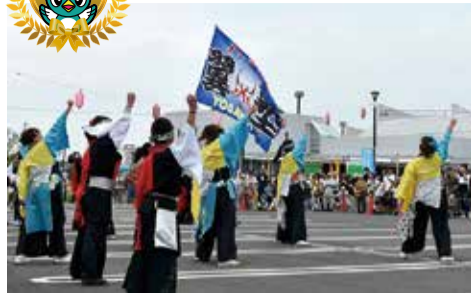
▲今年のステージイベントもよさこい演舞から始まりました。市内で活動する「YOSAKOI八千代」と「八千代舞夢小町」の2チームがステージをいっぱいを使い、演技を披露しました