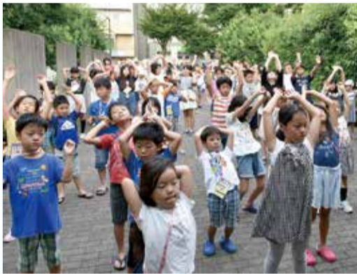
▲多い日は150人以上が参加し、一緒に体操しています

参加した子どもたちは、「おじいちゃん、おばあちゃんと仲良くなれてよかった」とにっこり。地域のつながりを実感していました。