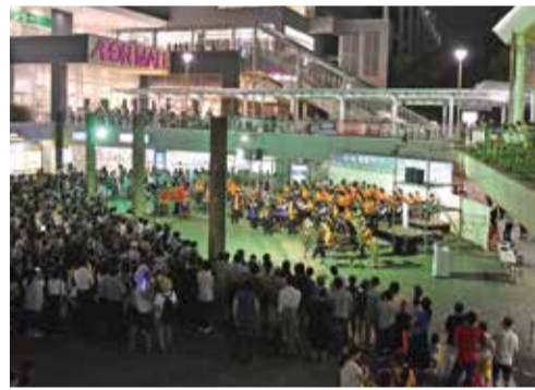
▲八千代高校吹奏楽部による演奏

7校8団体が参加。仕事帰りの人や買い物客なども足を止めて、夏の夜に響く迫力ある演奏に耳を傾けていました。