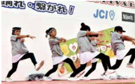
▲小学生の部8チームと中学生の部4チームによるダンス甲子園。小学生の部は「TSUBU」(写真)、中学生の部は「STAY HOOD」が優勝。キレのあるダンスで会場を魅了しました