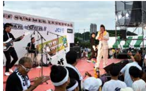
▲4人組ロックバンド「ザ・ナゲッツ」によるライブ。ザ・ナゲッツ仕様にデザインされた自転車での登場や、ステージ上で観客と一緒に踊るなど、さまざまな演出に会場は盛り上がりしました