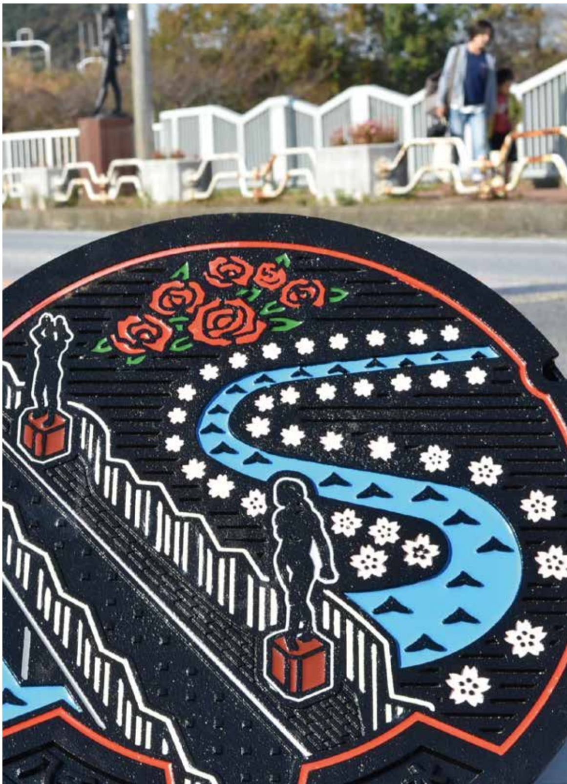
▲オリジナルデザインの八千代市だけのマンホール蓋です

足元からこんにちは。私は、下水道事業着手50周年を記念して作られたカラーマンホール蓋です。八千代を代表する、バラ、新川、千本桜、村上橋といった風景がいっぱいできれいでしょ。自分では新川やバラの鮮やかなところがとても気に入っているんです。市民の皆さんに親しんでもらえるように、上下水道局の人たちが頑張ってデザインを考えてくれました。今、流行のマンホールカードも作ってもらいたいなあ。12月末までに、市内の駅周辺の歩道に30基の仲間が登場するので、どこにいてもかぜひ足元を探してくださいね。でもそのときは車や周りの人に気を付けて。早く皆さんの笑顔に会いたいです。