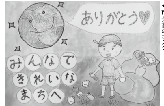
市長賞のポスター