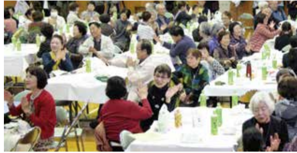
▲萱田中学校の生徒や、隣の席の人と歌に合わせてハイタッチ。みんな自然と笑顔があふれました

れました。ボランティアの皆さんの協力にも支えられ、200人以上が参加し、幅広い世代の人たち同士が交流できました。