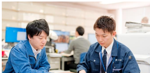
建築指導課(建築職) 町田技師

交流保育や研修などを通じて他園の保育士とも関わる機会が多くあります。多くの人に出会い、様々な保育観に触れ自分自身の学びにもなります。